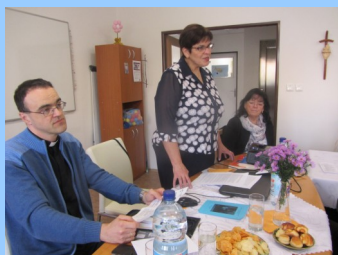
Daruj Vianoce 2018

Svätou omšou, rozjímaním a diskusiou sa ukončila duchovná obnova na sviatok narodenia Panny Márie a bl. Frederika Ozanama, ktorého smrť si v ten deň spomínáme.