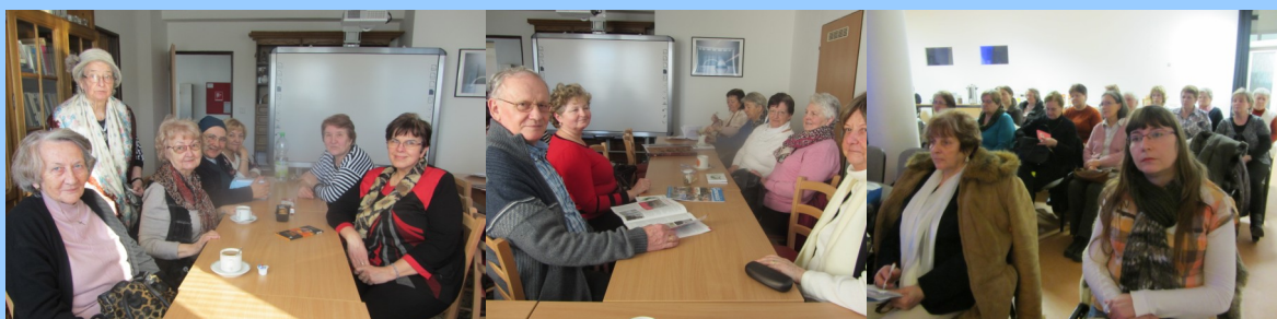
Duchovná obnova 08.09.2018