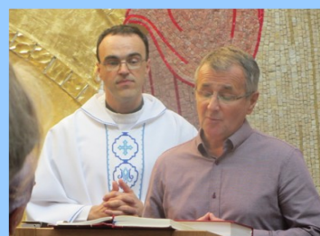
Vincentská komisia 17. 3. a 22.8.2018