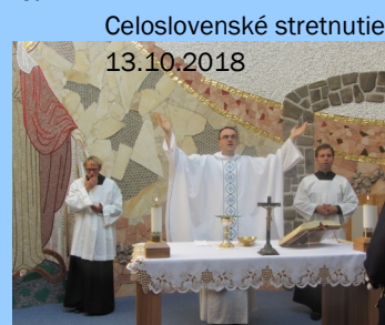
Celoslovenské stretnutie 13.10.2018